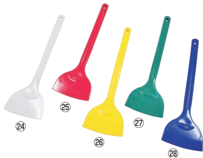
シリコンサラクリーナー 大 91