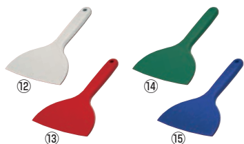
シリコンニュークリーンヘラ L 91

幅55×全長260 材質:シリコン/芯:66ナイロン、鋼材 耐熱温度:-20~230℃