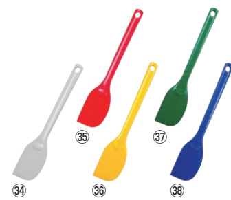
シリコンクリーナー 91

幅120×全長220 材質:シリコン/芯:66ナイロン 耐熱温度:-20~200℃