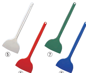
シリコンニュークリーンヘラ 大 91

幅140×全長500 材質:シリコン/芯:66ナイロン、鋼材 耐熱温度:-20~230℃