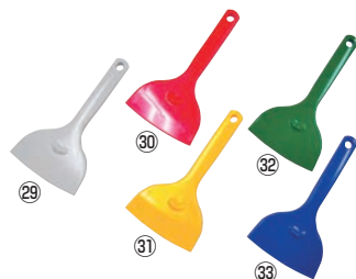
シリコンサラクリーナー 91

サイズ:幅130×全長390 材質:シリコン/芯:66ナイロン 耐熱温度:-20~200℃