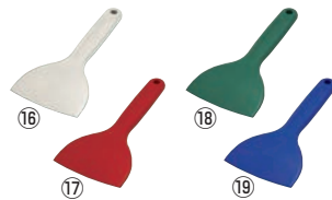
シリコンニュークリーンヘラ S 91

幅120×全長210 材質:シリコン/芯:66ナイロン 耐熱温度:-20~230℃