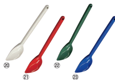
シリコンニュークリーンヘラ スプーンタイプL380型 91

幅90×全長200 材質:シリコン/芯:66ナイロン、鋼材 耐熱温度:-20~230℃