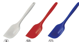
シリコンニュークリーンヘラ 小 91

幅130×全長390 材質:シリコン/芯:66ナイロン、鋼材 耐熱温度:-20~230℃