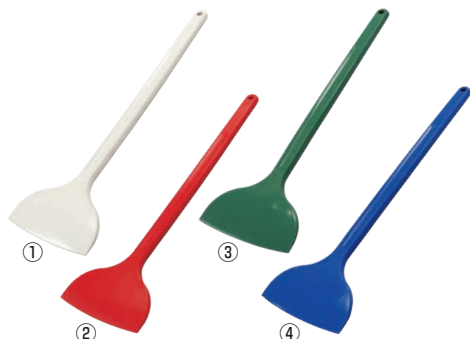
シリコンニュークリーンヘラ 特大L500型 91